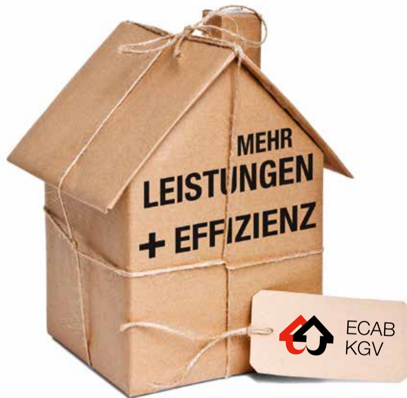
* das Gesetz wird 2017 dem Volk zur Abstimmung unterbreitet

Neues Gesetz über die Gebäudeversicherung, die Prävention und die Hilfeleistungen bei Brand und Elementarschäden