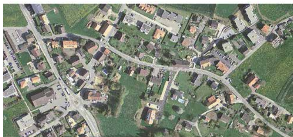
En matière d'aménagement du territoire, il a beaucoup été question de l'étalement urbain et de l'augmentation de la densité. Seules 80 années séparent ces deux vues aériennes de Misery, et l'on s'aperçoit que l'arrachage des arbres doit également être combattu, surtout en zones périurbaine et campagnarde.

cadre de l'aménagement du territoire, d'un quartier ou d'un jardin, concrètement, il s'agit en premier lieu de :