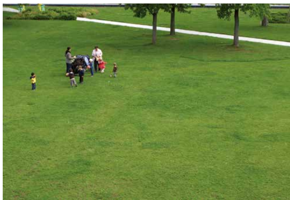
Dans un quartier, un parc plus petit mais aménagé et entretenu proche de l'état naturel vaut mieux qu'une gigantesque et morne pelouse.